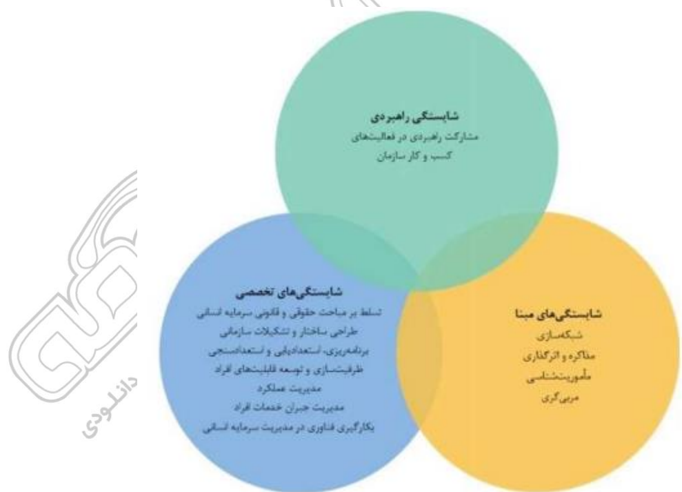
شکل ۳- مدل شایستگی مدیران سرمایه انسانی

در شکل ۳ شایستگی های مبنایی، تخصصی و راهبردی مدیر سرمایه انسانی مشخص شده است. در بخش شایستگی های راهبردی یک شایستگی با عنوان: «مشارکت راهبردی در فعالیتهای کسب و کار سازمان»، در بخش شایستگی های تخصصی هفت شایستگی با عناوین: «تسلط بر مباحث حقوقی و قانونی سرمایه انسانی»، «طراحی ساختار و تشکیلات سازمانی»، «برنامه ریزی استعدادیابی و استعداد سنجی»، «ظرفیت سازی و توسعه سرمایه های انسانی افراد مدیریت عملکرد»، «مدیریت جبران خدمات افراد» و «بکارگیری فناوری در مدیریت سرمایه انسانی» و در بخش شایستگی های مبنا چهار شایستگی با عناوین: «شبکه سازی»، «مذاکره و اثرگذاری»، «مأموریت شناسی» و «مربی گری» در نظر گرفته شده است.